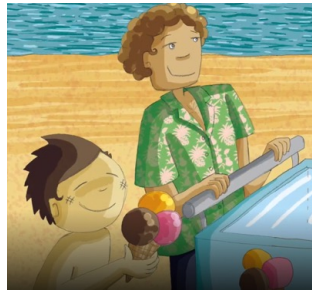
Manger des glaces (comer sorvetes)