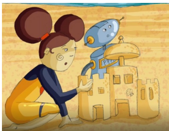
Jouer dans le sable (brincar na areia)