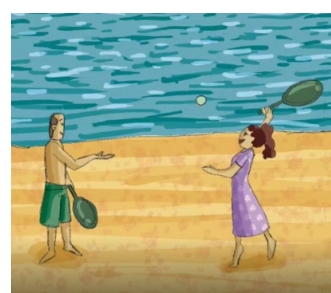
Jouer avec des raquettes (Brincar com raquetes)