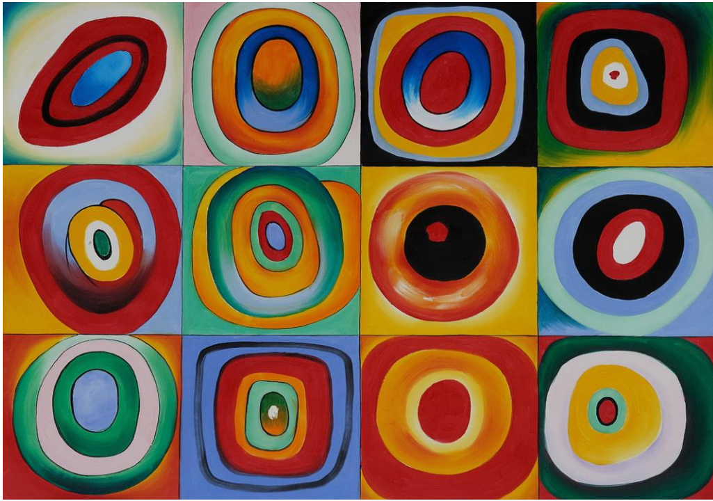
"FARBSTUDIE QUADRATE (COLOR STUDY OF SQUARES)" KANDINSKY.

CRÉER UN ARBRE INSPIRÉ PAR LES ŒUVRES DE KANDINSKY. (CRIAR UMA ÁRVORE INSPIRADO NA OBRA DE KANDINSKY).