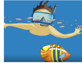
LE PETIT FRÈRE

3- Remplissez les phrases ci-dessous en disant qui entre dans le château et qui n'entre pas dans le château.