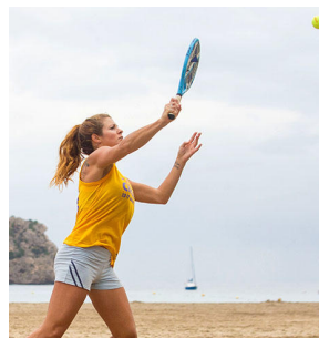
JOUER AVEC DES RAQUETTES