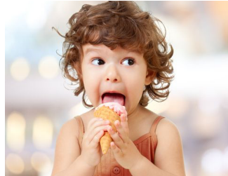
MANGER DES GLACES