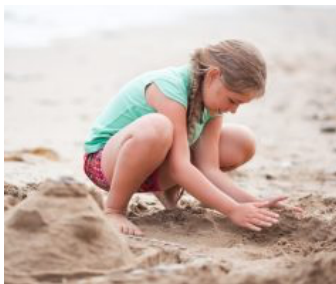
JOUER DANS LE SABLE