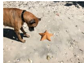
REGARDER LES ÉTOILES DE MER,