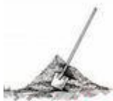
Un tas de sable